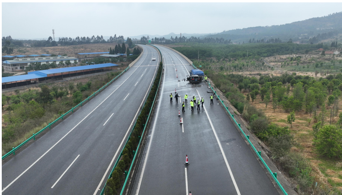
图 1 事故现场航拍图

受撞脱落，脱落面积为： 1.05 \times 0.33 平方米，脱落处距右侧车尾部 0.32 米；该车后挡风玻璃受撞全部脱落，脱落面积为： 1.49 \times 0.55 平方米。经勘验以上痕迹均系川 EN6J29 号小型普通客车车头前部与云 D4425J 号车左侧尾部相撞形成。