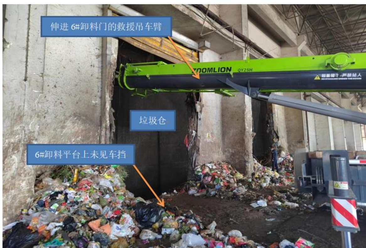
图 2 6#卸料平台车档损失情况

据曲靖云能投公司垃圾卸料大厅视频图像显示：2022 年 11 月 2 日上午 11 时 53 分 01 秒（视频监控时间）垃圾卸料大厅内未见垃圾卸料引导员进行现场引导。