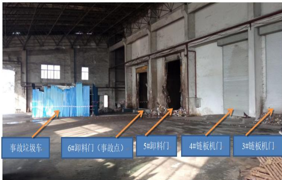
图 1 垃圾卸料大厅图

直通垃圾仓，其中 6#、5#卸料平台及卸料门专供垃圾转运车卸垃圾，4#至 1#门为链板机专用门，处于常闭状态。